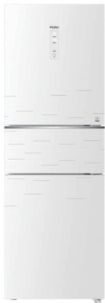
(此图为BCD-219WDGD) (冰箱外观、颜色、图案以实物为准)